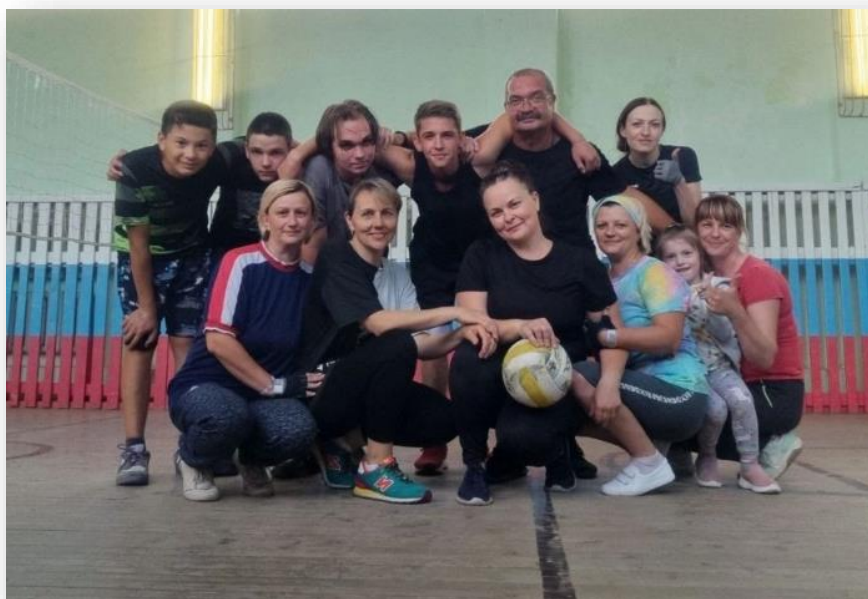
Товарищеский матч между детьми, воспитателями и родителями в рамках спартакиады «Мы за здоровый образ жизни»

В лагере уделялось большое внимание пропаганде правильного питания и формированию навыков здорового образа жизни. Чтобы дети дышали свежим воздухом, максимальное количество мероприятий и режимных моментов проходило на улице.