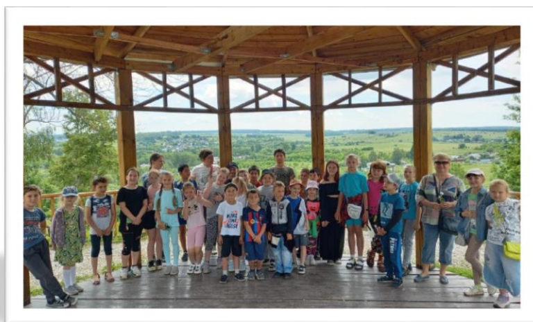
На смотровой площадке с. Крапивна

Работа по данному направлению способствовала расширению знаний детей об истории и культуре родного края. Детям была проведена экскурсия по родному селу.. Путешествуя по улицам Крапивны узнали о чудодейственных свойствах крапивы. Чай на крапивных листьях, варенье из крапивы и конечно же знаменитые Крапивные щи.