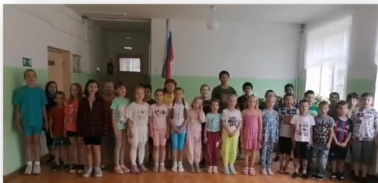
Гимн России всей страной

В день памяти и скорби прошла вахта памяти. Дети возложили цветы на братскую могилу в с. Крапивна и на братскую могилу в роще Муром у д. Жердево.