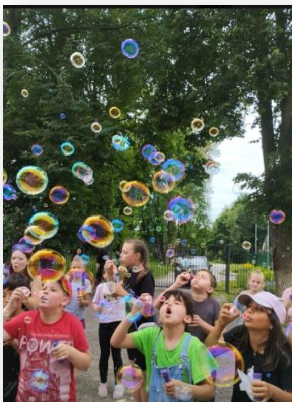
День мыльных пузырей

Много радости детям доставил «День мыльных пузырей». В жаркий солнечный день в небо полетело огромное количество переливающихся шаров.