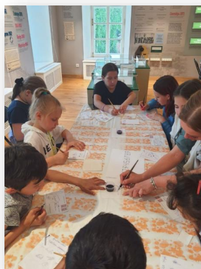
Мастер-класс «Открытка маме»